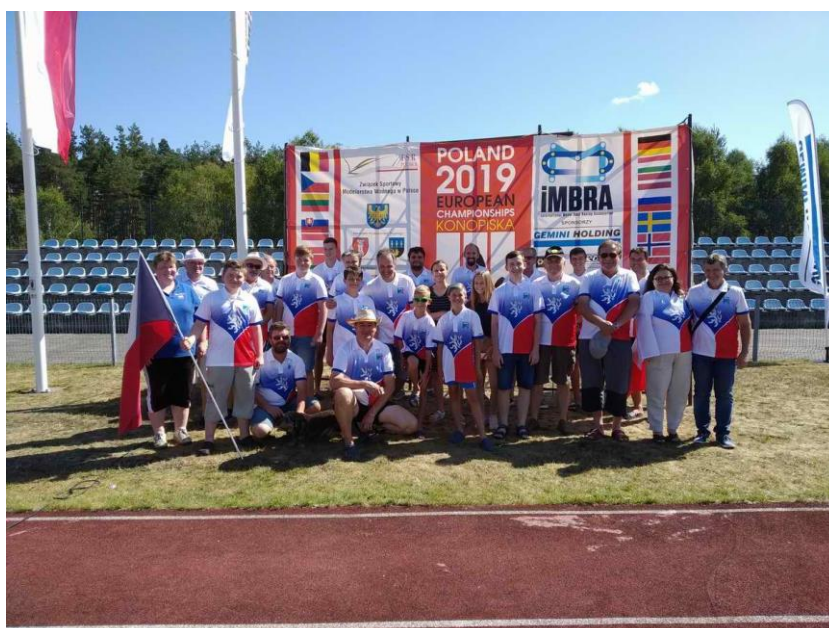
ME IMBRA sekce FSR celý reprezentační tým ČR