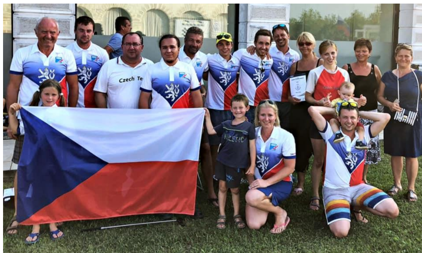
MS sekce M celý reprezentační tým ČR